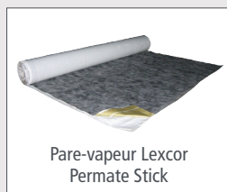
Pare-vapeur Lexcor Permte Stick