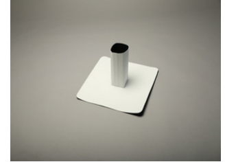
Recouvrement de tube carré