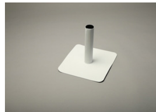
Recouvrement de tuyau