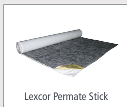
Lexcor Permaste Stick