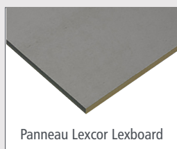
Panneau Lexcor Lexboard