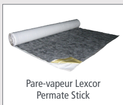
Pare-vapeur Lexcor Permte Stick