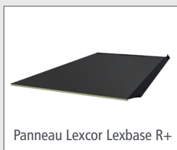
Panneau Lexcors Lexbase R+