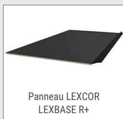
Panneau LEXCOR LEXBASE R+